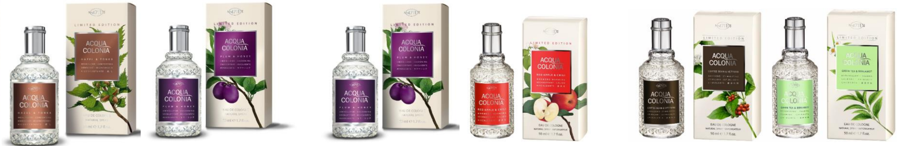
Hazel & Tonka Plum & Honey